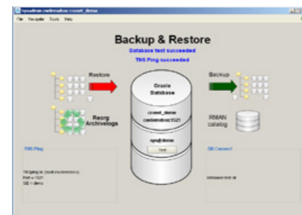
Die Zusatzfunktion cronetwork sysadmin advanced bietet eine Vielzahl praktischer online backup- und restore-Tools.

Den Import und Export von Datenbankschemen, die Datenbank-sicherung , den Dump ex- und import sowie den Datapump können Sie zukünftig aus einer komfortablen cronetwork sysadmin Oberfläche durchführen. Der Export kann auch automatisch im Hintergrund als geplanter Task ausgeführt werden ( silent mode ).